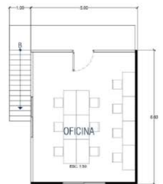
OFICINAS PLANTA ALTA